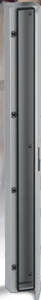
Produkte für die Brandlastdämmung (Feuerwiderstand)