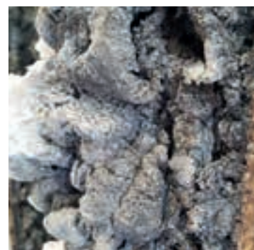
Fotodokumentation von Brandversuchen mit swibox Schränken