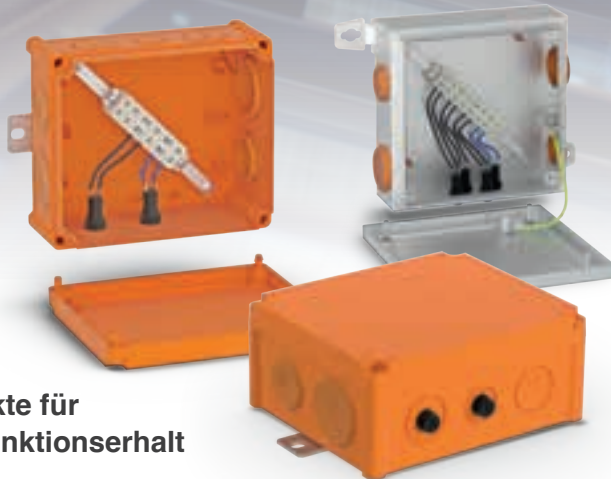
Produkte für den Funktionserhalt