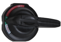
Griff, abschließbar mit Vorhängeschloss, Testmodus (30 bis 60 A)

* Lasttrennschalter ohne Sicherung müssen separat installierte Sicherungen verwenden, um den Kurzschlusschutz vorgeschalteter Geräte zu gewährleisten.