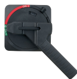
Griff, abschließbar mit Vorhängeschloss, Standard (30 bis 60 A)